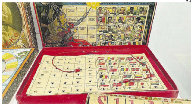
LAS BANDERAS DEL MUNDO EN LOS AÑOS 30

► 'Carreras de caballos-Hipódromo' es el juego de mesa más antiguo de la exposición, de la década de los años 20. Se accionaba con una manivela a la izquierda y los caballos avanzaban por el tablero.